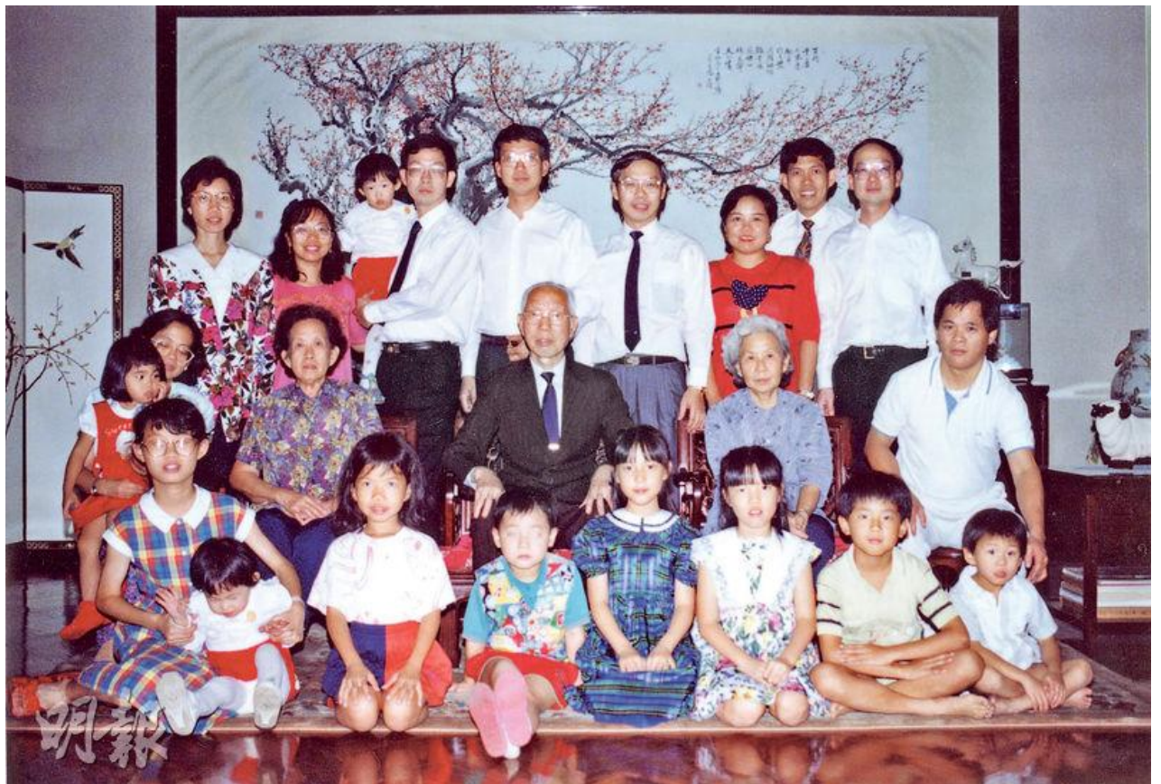
圖 5 之 3 - 田家炳（第二排中）育有 9 名子女，兒孫滿堂。他重視與家人團聚的 . . . . .