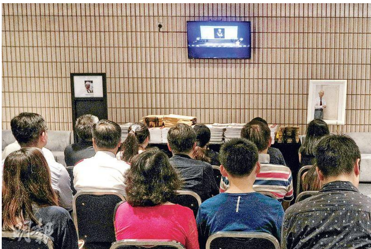
圖 5 之 4 - 田家炳追思會昨於文化中心大劇院舉行，公眾不用預約進場，大劇院 . . . . .