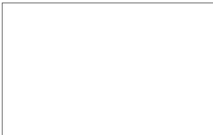
在田氏化工廠進行訪問

總括來說，我們從問卷的統計中，得知兩地人民對傳統家觀念的異同，分析兩地人民於家庭觀念上的轉變，和傳統家庭觀念對兩地人民的影響。此外，因為珠江三角洲的中國人較直接受到傳統中國的思想的影響，而香港則曾是英國殖民地，大多數的香港人都受到西方思想所影響。因此，即使珠江三角洲及香港人同是中國人，兩者的思想亦是有差別的。