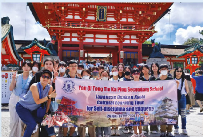
領袖生日本禮儀之旅 2024