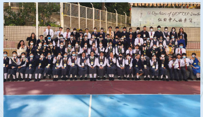
BBS成員參與學校開放日校園大使工作

我們認為, 成為一名出色的學生領袖需要具備三大特質: 「勇敢、改變、堅持」。作為領袖者, 需要有勇氣在人前表達自己的想法; 在發現自己的不足時, 也要勇於改變, 尋求進步; 最後, 即使面臨重重困難, 也要堅持做對的事情, 勇往直前。