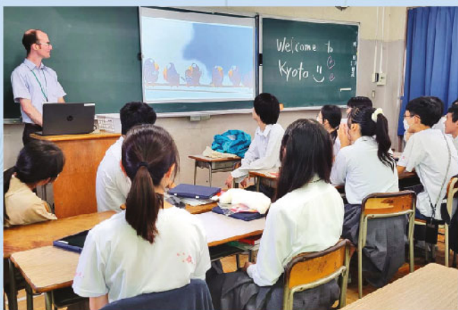
本校領袖生與日本高中生交流

經過多年的努力，受到老師們的青睞，我在中三時升任副領袖生長，並在中四和中五時擔任領袖生長的重責。除了校內的日常當值，我還需要在百忙之中抽空編寫每月當值表和協助籌辦活動，亦要準備資料舉辦領袖生大會，以了解領袖生的當值狀況。對於踏入高中階段的我，一邊兼顧繁忙的學業生涯，一邊兼顧領袖生隊的各種事務，確實不容易，但這正正是給我一個學會時間分配的好機會，抗壓能力也漸漸上升，正因為經過這些考驗，我才能游刃有餘地解決各種事情。即使如此，從「執行者」變「領導者」這種身份轉變對我來說是最艱難的時期，起初多次的撞板使我擔心沒法勝任這個職位，但當我回頭一望，看見自己多年走過的路，回想起當我初初成為領袖生時師兄師姐對我的悉心指導，讓我重拾自信，繼續以相同的精神帶領他人前進。要成為出色的領袖，就應表現出良好的品德和責任感，亦要具備時間管理能力和團隊合作精神，在當值時給予清晰的指示，有自信地完成工作，才能成為同學們的榜樣，更能帶領團隊再下一程。