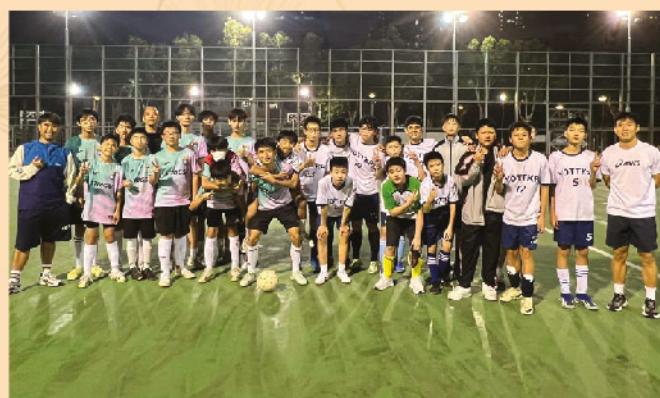
與南屯官的友誼賽