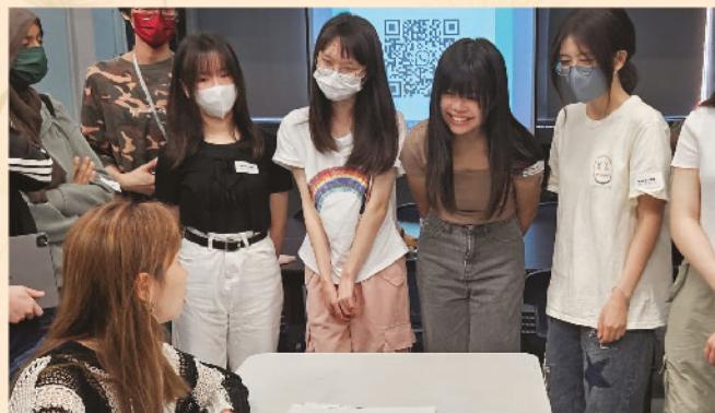
向校外導師學習速寫