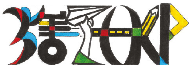
35周年標誌設計比賽 初中組冠軍