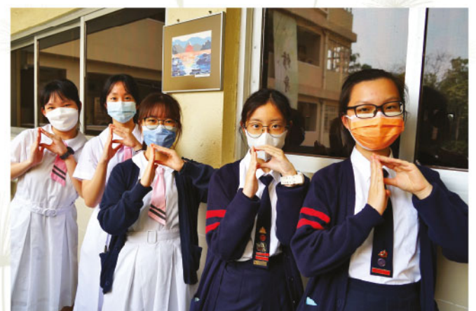
領袖生與德愛中學交流 2023