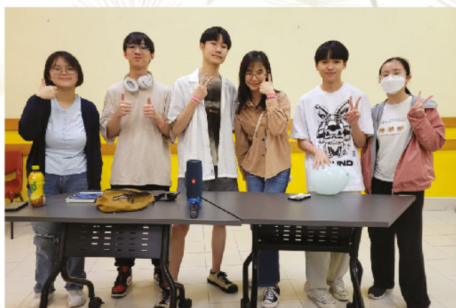
我們和BBS組長籌辦中一復活節營會活動

BBS是一個透過各類迎新及不同的活動，增強新生與校園的聯繫，促進他們與同學、老師的融合。我們會提供訓練予一班中二至中五的BBS去協助中一同學，適應中學生活，為中一同學作好榜樣。作為BBS的一員，我們不僅能夠協助中一同學融入校園生活，也能在活動籌備和執行過程中，發掘和發展自己的領導潛能。