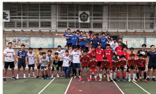
與可譽&蔡功譜&聖士提反堂中學的友誼賽