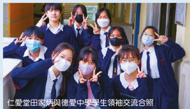
仁愛堂田家炳與德愛中學學生領袖交流合照