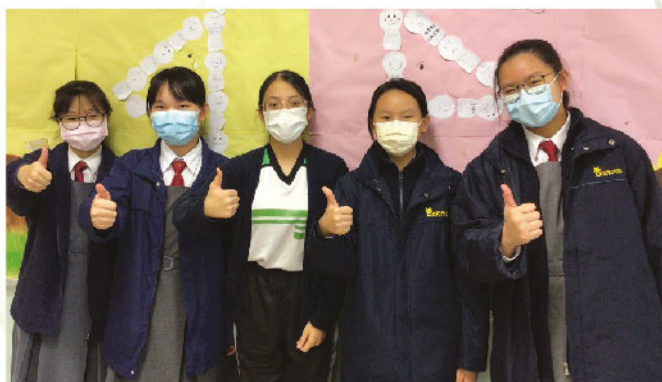
一次拍攝晨光雋語時受訪者與成員的合照（圖三）

我們負責連繫老師、成員及受訪者，組織「晨光雋語」及「陽光人物周會」的採訪，而這需要良好的組織能力、聆聽能力和表達能力，才有助一次又一次的採訪成功，而成功之處有賴於成員間的緊密合作。領袖從來不只是下達命令，而是要了解整個團隊，尊重不同成員的意見和想法，冀達到「以人為本」。在互相尊重的氛圍下，我們以耳朵和心聆聽不同人的心聲，盡力關心他們的難處，如留意測驗時間，細心規劃拍攝時間表，以分配各成員的任務，包括準備採訪題目、撰寫訪問稿、主持採訪、後期製作及宣傳等，讓每位成員都有其發光點，充分發揮他們的才華。（圖三）