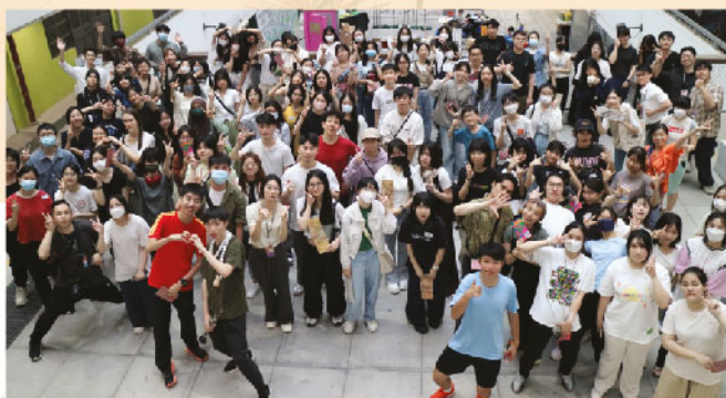
全體第十六屆校園藝術大使大合照

我從小對藝術抱有濃厚的興趣，好奇心促使我不斷地探索各樣的藝術形式及媒介。我熱愛買藝術參考書，在網上觀摩繪畫教程視頻，自小認真地沉浸在校內的每一節視藝課，盡最大的努力去完成並享受每一次的藝術創作，也因此而獲得好成績，以及老師和同學的讚賞。漸漸地，我不再滿足與局限於創造個人創作，而是希望能發揮更多個人的才能，貢獻給學校。因此我開始積極參與社團服務，擔任不同職位，宣傳藝術。從班會壁報小組，到學生會美術幹事，到校外的校園藝術大使計劃……回看過去中學四年間曾創作的壁報、標誌設計、海報宣傳等，我由衷地感到滿足。此外，校內亦有不少鍛鍊藝術才能的平台，讓我有機會不斷磨練，累積寶貴的經驗，例如：周年慶校徽設計比賽、運動服及衛衣設計比賽、陸運會場刊設計比賽等等。藝術豐富了我的經驗，帶領我涉獵更多的範疇。