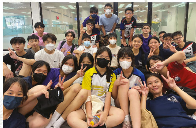
男女子排球隊隊員