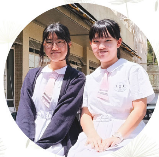
正副主席合照（圖四）