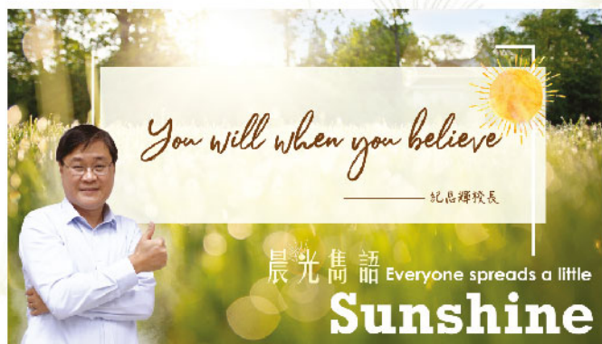
陽光大使訪問紀校長後獲贈的晨光雋語

當問及陽光大使時，我們說道：「每一個人都能帶來一點陽光。縱陰晴不定，但最後也有晴天吧！在一點一點的陽光積累下，我們相信這裡就會更溫暖，更正面。」