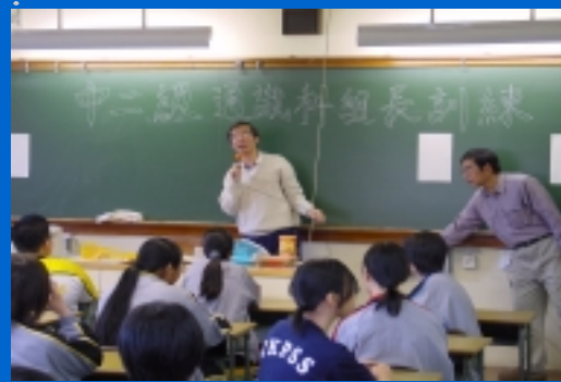
訓練前，老師作簡介