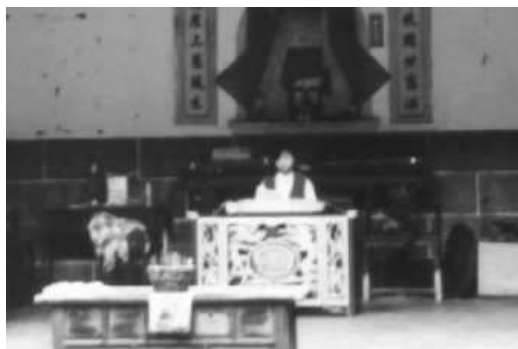
在慶成樓拜師學藝的女子

有些人會因爲想學唱山歌而去拜師，就像在慶成樓向山歌老師拜師學藝的女子一樣，因爲自己本身對山歌感興趣而去學唱山歌的。