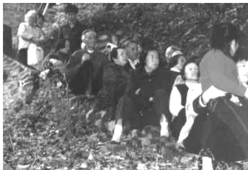
石階上唱山歌的公公婆婆

我們的親身體驗能夠證實文獻的資料是確實的，山歌的形式包括對唱，清唱，獨唱，樂器伴奏及載歌載舞。