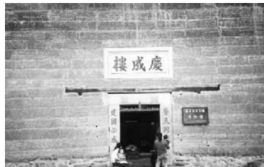
山歌老師開班授徒的地方----慶成樓

由於山歌是客家族的文化精髓，但有失傳的現象。因此，吸引了很多學者去研究山歌，令山歌變得學術化。從山歌編輯先生把山歌的歌詞重組，編輯成一本山歌的精華錄出版，以供大眾參考；以及從開班授徒的山歌老師身上亦可亦體現出客家山歌被視為一門學術。