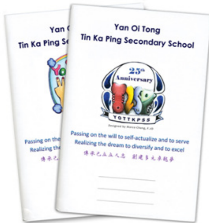
▼中二級同學的標誌設計作品。用於印製書簿封面。