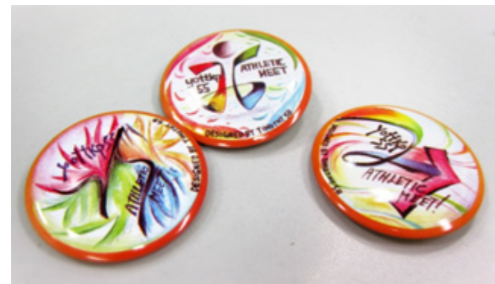
▲第25至27屆陸運會長跑徽章，皆由同學設計。