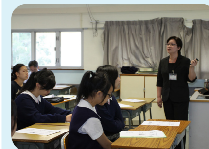
教育及職業輔導日 20/11/2011

參與的十多位義工家長，課程完畢後，預約邀請出任為本會一年一度的生態遊導賞員，可以嗎?努力學習!