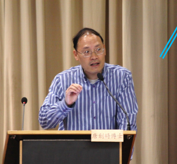
▲主講嘉賓：考評局秘書長唐創時博士

2012年是升讀本地大學的雙考年，即最後一屆(中七級)香港高級程度會考及第一屆新高中(中六級)中學文憑考試。我校升學及生涯教育輔導組為中六及中七級全體同學提供一次適切的升學資訊和行業介紹活動，以協助同學為未來的升學或就業前路提供更多及更新的資訊，並希望透過是次活動來鼓勵同學為即將來臨的公開試繼續努力，向目標奮進。當日全體中六及中七級同學及約50