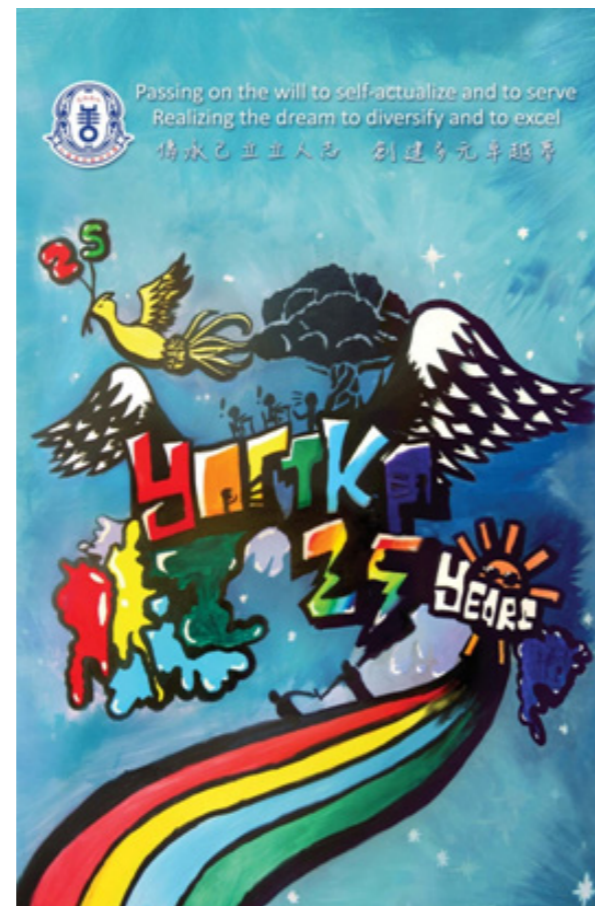
▼中四級選修視藝科同學作品。以塗鴉的手法表達創校25週年。作品用作25週年校慶資料夾封面。

視藝科是同學發揮創意的平台，提供機會讓同學表達內心的感受。同學的作品除了於校內展示外，亦會印成紀念品，用以配合學校活動，如陸運會長跑徽章、校慶紀念品，皆由同學設計。